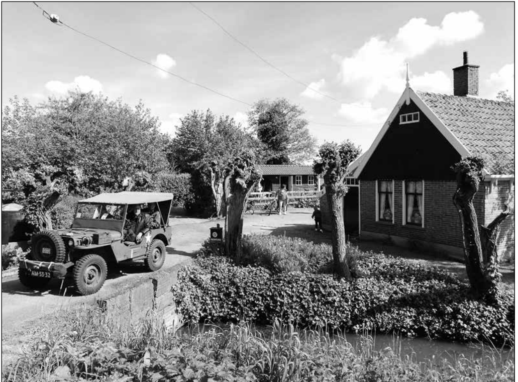
Willys oorlogsjeep bij het Huis van Oud