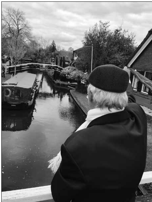
Cor zwaait St. Caecilia uit. Foto gemaakt tijdens het Bootconcert in Giethoorn op 21 april jl.

Benieuwd naar het concert? Neem een kijkje op onze (hernieuwde) website www.stcaecilia.com of onze sociale media. Tot ziens op zondag 9 juni om 14.30 uur op het plein naast De Witte Valk.