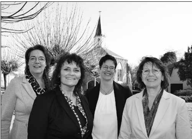
St. Barbara Zwaag St. Barbara Oosterblokker St. Jozef Blokker De Laatste Eer Blokker/Zwaag