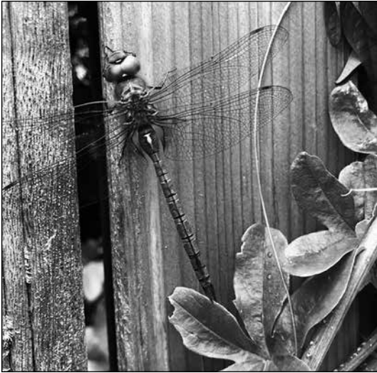
Ingezonden door Jaap Bakker uit Zwaag